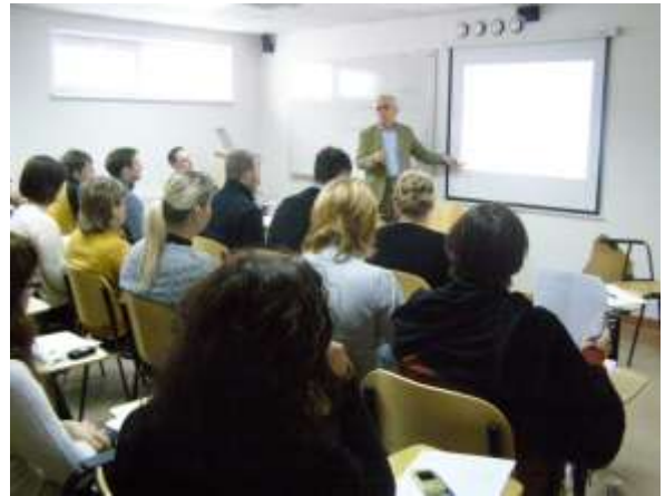
Ludovicus van der Post mokymai

2010 m. rugsėjo mėnesį įdarbinimo tarpininkai dalyvavo teoriniame praktiniame seminare „Į klientą orientuotas konsultavimas“, kurį vedė Nyderlandų ekspertas Ludovicus van der Post.