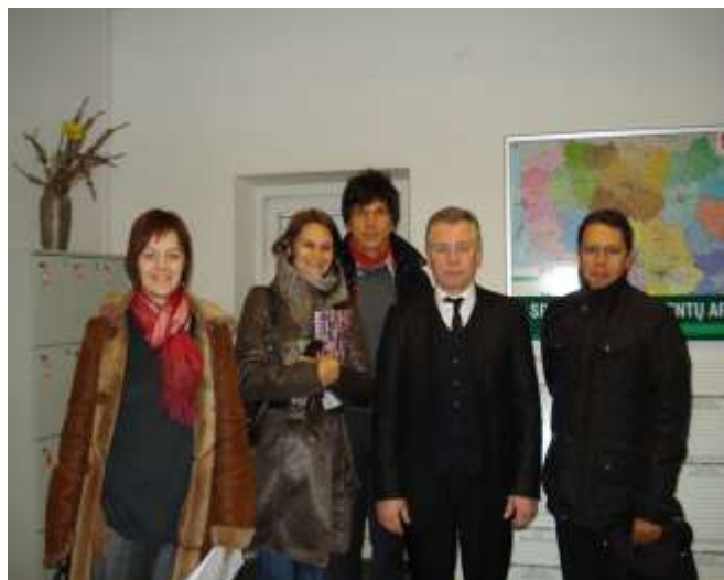
Svečiai iš Reunion lankosi Vilniaus darbo biržoje

Dalyvavome partnerių iš Reunion salos (Prancūzija) įgyvendiname projekte Jobssystem. 2010 m. gruodžio mėnesį organizavome partnerių apsilankymą Lietuvoje: keitėmis patirtimi, pristatėm geruosius Lietuvos projektų pavyzdžius.