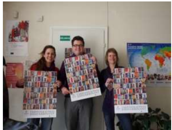
Picos atstovai Lietuvoje

Kovo mėnesį pasikvietėme į Lietuvą partnerius iš Nyderlandų ( Picos BV) ir organizavome praktinį seminarą „Remiamas įdarbinimas. Tarpininkavimo paslaugos socialinę atskirtį patiriantiems asmenims“. Didelę patirtį turintys Nyderlandų specialistai apmokė dirbti ir SOPA įdarbinimo tarpininkus.