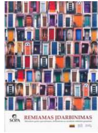
Metodinės gairės specialistams

Remiamo įdarbinimo modelis buvo pristatytas su socialinės rizikos šeimomis dirbantiems socialiniams darbuotojams, organizuojant praktinius mokomuosius – komandos formavimo seminarus, kurių tikslas - bendradarbiavimo stiprinimas įdarbinant socialinės rizikos asmenis. Seminarai vyko partnerių patalpose.